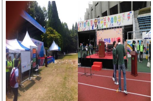
■ 인터넷진흥원, 현대로지엠 체육대회