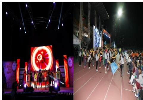
■ 동화세상에듀코 별밤,가을축제