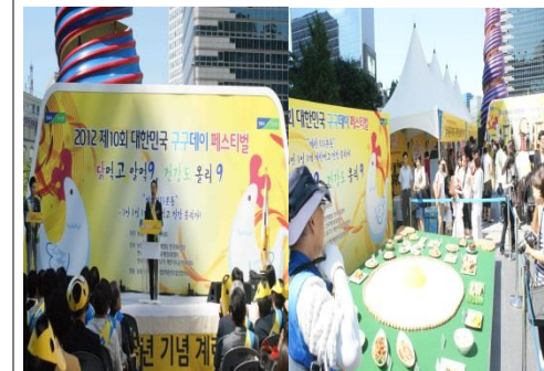
■ 농협 구구데이 페스티벌