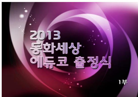
■ 행사타이틀(영상 스틸컷)