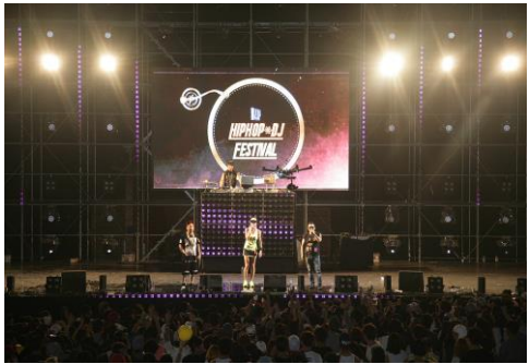
■ 제1회 양지파인 HipHop & DJ페스티벌