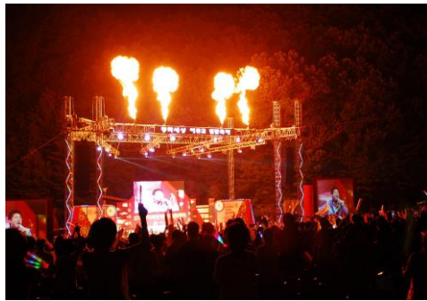
■ 동화세상 에듀코 별밤축제