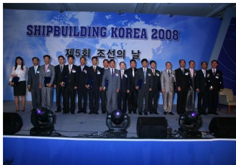
■ 조선의날 기념식