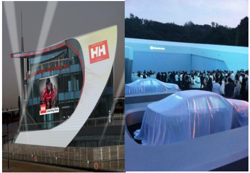
■ 헨리한센런칭쇼, 벤츠 C-CLASS 런칭쇼