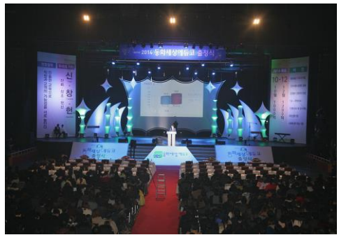
■ 동화세상에듀코 출정식