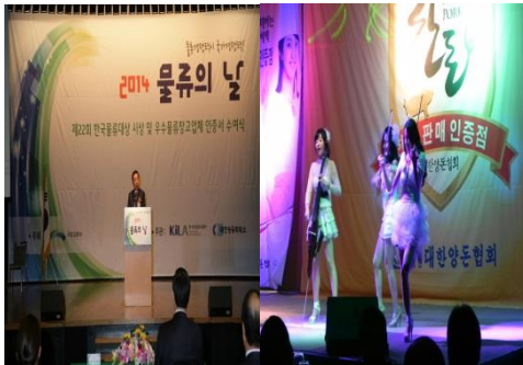
■ 문류대상시상식, 한돈인증부여식