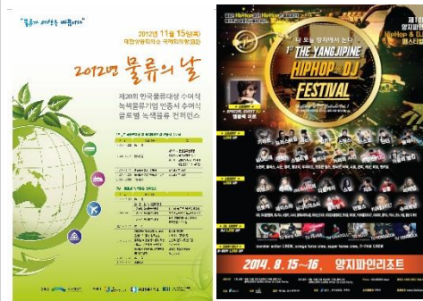
■ 포스터(물류대상, 양지HipHop & DJ페스티벌)