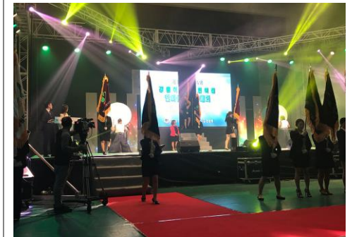
■ 강원어린이집 한마음대회