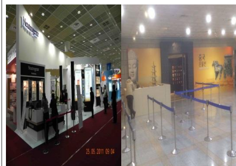
■ WCD 세계피부과학회, 중국문물전