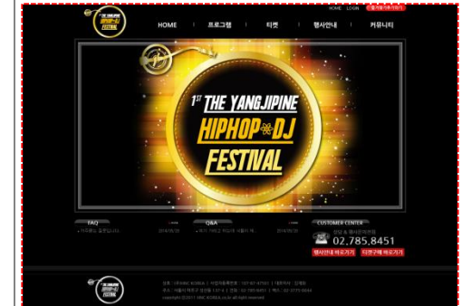
■ 웹디자인(힙합&dj 페스티벌)