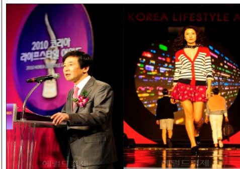
■ 동아tv라이프스타일 어워드