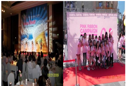
■ 메가CC월드비어페스티벌, 핑크리본캠페인