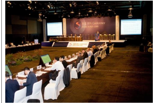
■ IIFA CONFERENCE