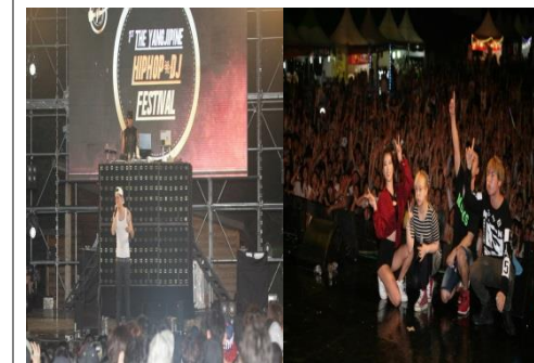
■ 제1회 양지파인 HipHop & DJ페스티벌 (자사 자체제작 공연 5,000명 관객)