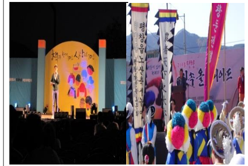
■ 파주 북페스티벌, 평창민속올림픽