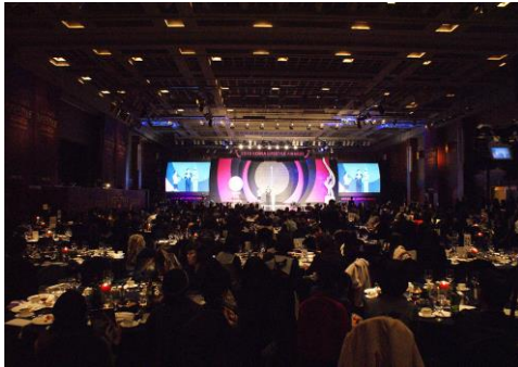
■ 동아tv라이프스타일 어워드