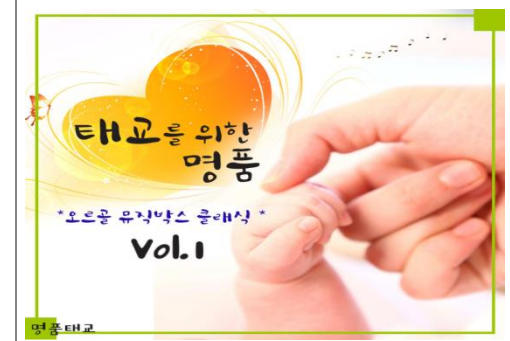
■ 디지털앨범(태교를 위한 명품오르골 뮤직박스 클래식)